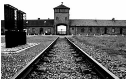
Entrada do campo de concentração de Auschwitz, na Polônia.

Em setembro de 1939, quando a Guerra começou, eu tinha 11 anos. No ano seguinte, eu e minha família fomos confinados no gueto de Shredlice, na Polônia. Em 1943, numa das seleções que os nazistas realizavam para separar os mais frágeis dos aptos ao trabalho pesado. Meus pais e minha irmã de 5 anos foram levados em vagões de gado para o campo de concentração de Auschwitz. Após a Guerra eu iria ficar sabendo que todos eles haviam sido mortos nas câmaras de gás.