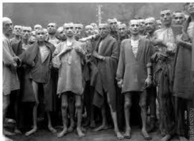
Judeus resgatados pelas tropas aliadas

Holocausto é uma palavra de origem grega que significa “todo queimado” (ver definição na capa deste fanzine) e é uma referência ao sacrifício que os povos antigos realizavam para seus deuses. Os judeus do Antigo Testamento realizavam holocaustos para Jeová. O holocausto hebraico era realizado como uma forma de expiação aos pecados cometidos, levando o indivíduo à purificação.