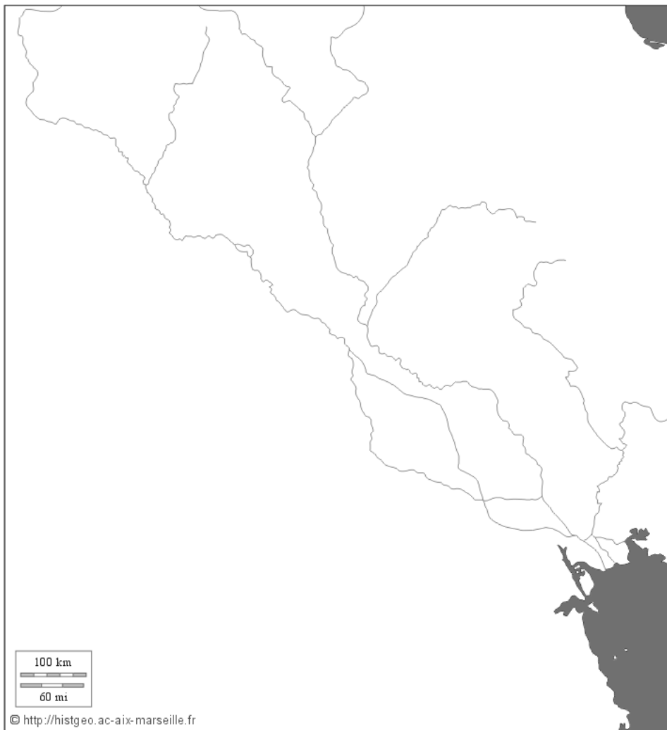
Mesopotâmia – Rios Tigre e Eufrates