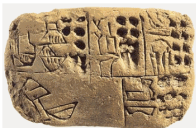
O cuneiforme surgido na Mesopotâmia é uma das mais antigas formas de escrita conhecida.

Como forma de suprir essas necessidades os homens criaram uma importante forma de registro, a escrita. Inicialmente, esses registros tinham apenas a função de registrar eventos práticos ligados ao mundo do trabalho como os já citados. Contudo, pouco-a-pouco as primeiras formas de escrita passaram a registrar as ideias e aquilo que se desejava comunicar, como os textos sagrados e as leis.