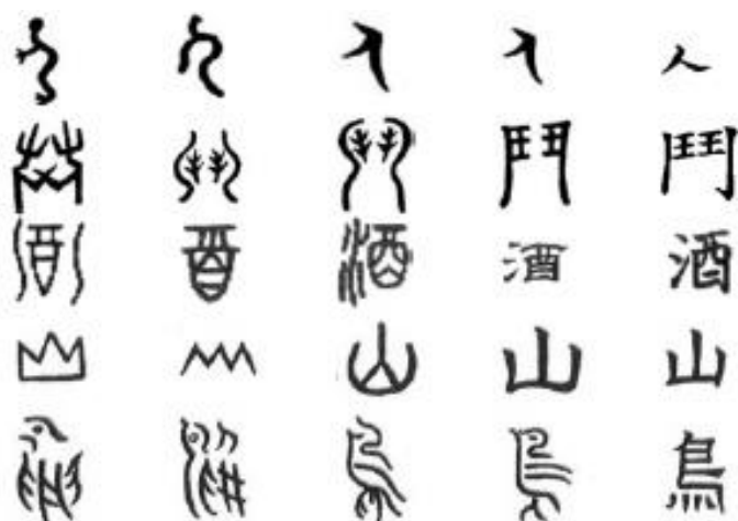
As primeiras formas de escrita evoluíram de simples desenhos